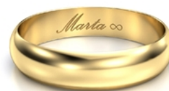
Kaligrafia znak nieskończoności