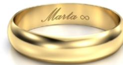
Kaligrafia znak nieskończoności