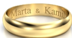
Mały druk Dwa imiona ze znakiem „and”