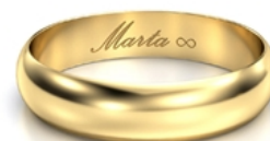
Kaligrafia znak nieskończoności