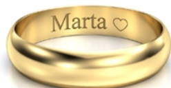
Mały druk pojedyncze serduszeko