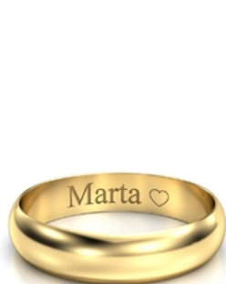
Mały druk pojedyncze serduszek